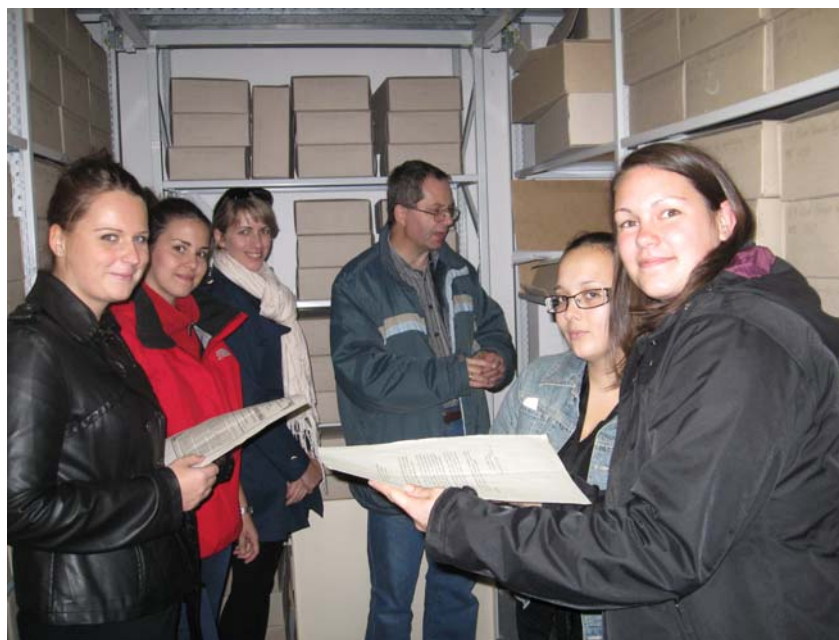
A levéltár raktárában kuriózumokkal a kezünkben